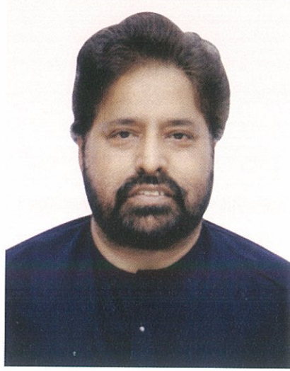
श्री सुदीप बंद्योपाध्याय माननीय केन्द्रीय स्वास्थ्य एवं परिवार कल्याण राज्य मंत्री