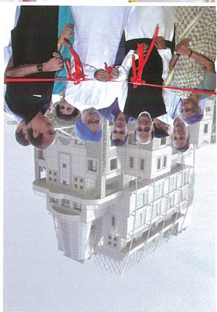
दिनांक 26.09.2010 को स्पॉट्स इंडिया सेंटर, सफरखंजा अस्पताल, नई दिल्ली का आरंभ प्रयागवती डा. मनमोहन सिंह द्वारा उद्घाटन