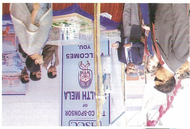
दिनांक 4 एवं 5 फरवरी, 2011 को रायबरेली में आयोजित स्वास्थ्य मेले में एच एच सी सी स्थल पर यू.पी.ए. अख्यता श्रीमती सोनिया गांधी का आगमन